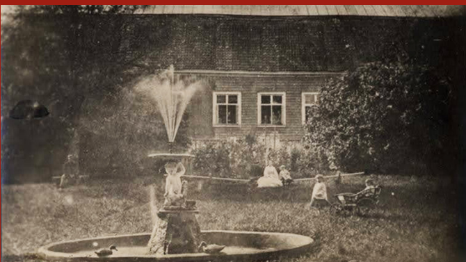
Lustivere mõisa barokne hoone