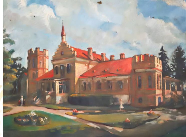
Evald Okas. Lustivere mõis. 1935 (õli, lõuend)

Siseplaneering on valdavalt ebasümmeetriline; vestibüül, peasaal jm ruumid on eklektilised. Rikkalikult on kasutatud väärspuitu.