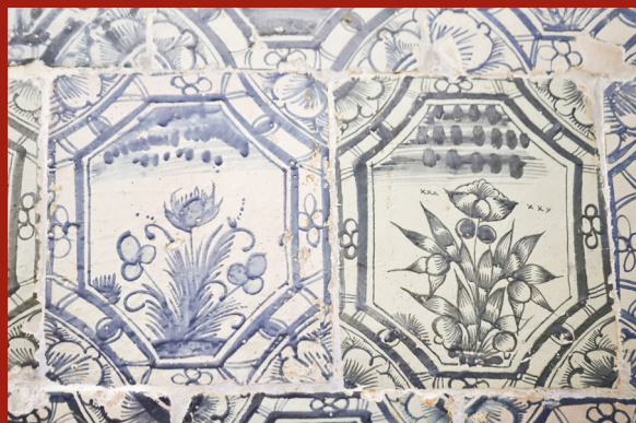
Ahjukahlid peahoone I korruse koridoris